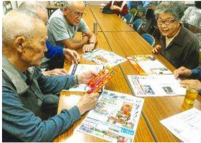
配布された広報紙とチラシを見る老人クラブ会員（福岡市博多区）

【ここがポイント】 完成した広報紙は配布系の会員から会員への直接の手渡し。個別訪問や会合の際に配布されます。