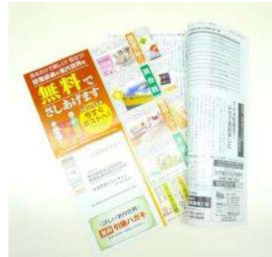
「ページを開くとすぐ目に触れる」ことで他媒体と差別化しています。

【ここがポイント】 折込チラシは広報紙の「p2～p3」に挟み込まれます。読もうとすると必然的に読者の目に触れます。