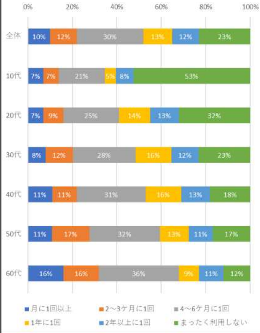
クリーニング店利用頻度